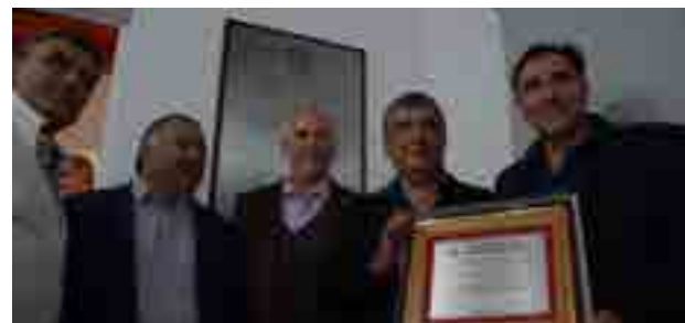
El Gobierno de Pto. Gral. San Martín entregó una placa conmemorativa en la reinauguración de la sede