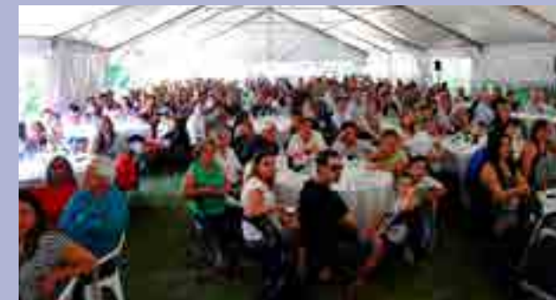
La celebración en La Reja reunió a una verdadera multitud de afiliados con sus familias.