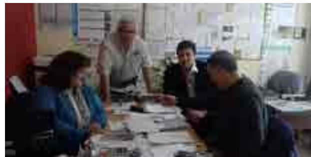
La delegación Puerto Madryn a pleno

Afiliados del Sur argentino viajaron cientos de kilómetros para participar en el proceso electoral