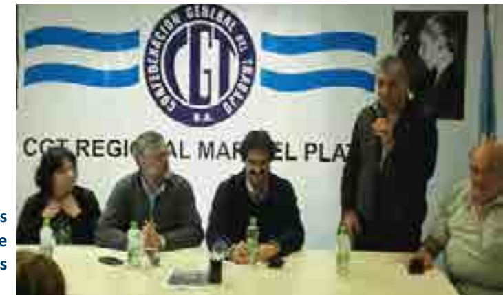
Debate sobre las problemáticas del sector en la CGT Mar del Plata

Un acuerdo resolvió el conflicto en los buques fresqueros, en medio de una crisis sectorial que demanda lucha constante por mantener las fuentes de trabajo