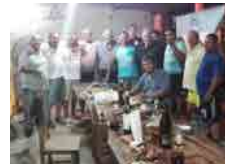
Los afiliados de Formosa compartieron un asado en la delegación.

2017 dejó muchos logros para festejar, y así lo demostraron los delegados y afiliados que se han reunido para despedir el año en distintas sedes del interior del país.