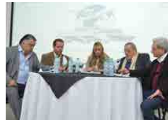
El Encuentro de agosto en Paraná

Aquí los disertantes concientizaron al público sobre la importancia de un nuevo régimen legal para la marina mercante y la industria naval –previo a la aprobación de los respectivos proyectos en el Congreso Nacional– para el desarrollo nacional y regional, la necesidad de promover la navegación también en el río Uruguay, y la importancia del desarrollo de los puertos sobre los dos grandes ríos que bordean esta provincia.