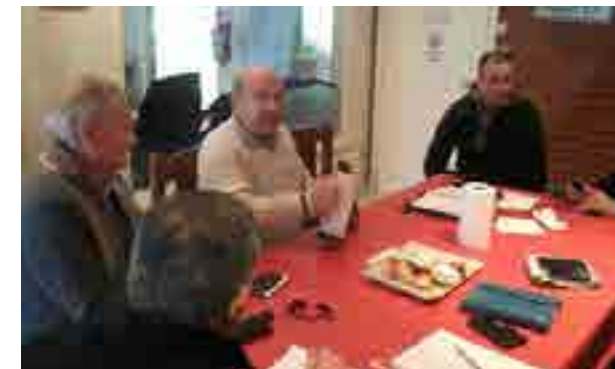
Reunión de trabajo en la sede Mar del Plata

“Ni repros ni subsidios: los barcos a la mar a producir”: Con esta consigna, nuestros delegados marplatenses participaron también en la reunión llevada a cabo el 8 de junio en la sede local de la CGT, donde los sindicalistas trataron temas relacionados con el agro, obras públicas y, por supuesto, la pesca, con el Ministro de Trabajo de la Provincia de Buenos Aires, Marcelo Villegas, y el de Agroindustria, Leonardo Sarquis.