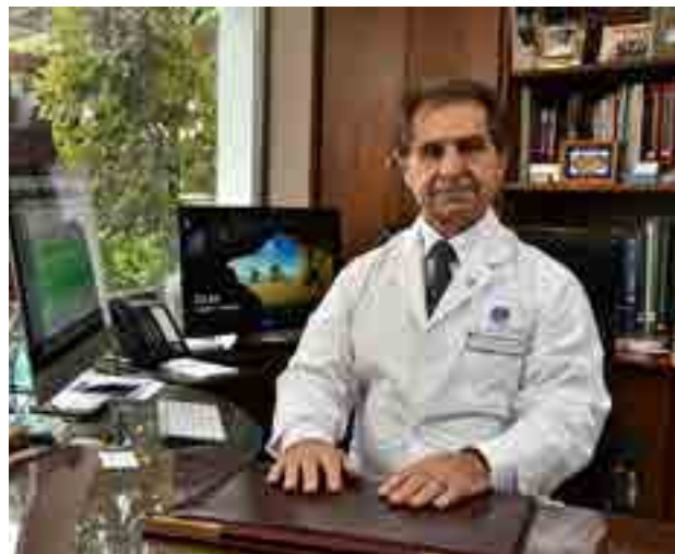
Dr. Pedro Lylyk

– Porque por cada minuto que se tarda se mueren dos millones de neuronas. Por eso nuestra ambulancia está equipada para tratar al enfermo en el camino: mediante tomografía, exámenes de sangre y ecografías, que son transmitidas a la Clínica, los médicos pueden tomar decisiones en forma inmediata. Primero, para salvar la vida del paciente, que es el mayor riesgo: la tercera parte de los que padecen un ACV fallecen, otra tercera parte queda con algún tipo de discapacidad, y sólo una tercera parte sale indemne. Luego, para disminuir el grado de secuelas, porque el ACV es la enfermedad que más discapacidad causa en el mundo, dependiendo de la zona del cerebro a la que afecte (visión, motricidad, sensibilidad, lenguaje, etc.) y obviamente del