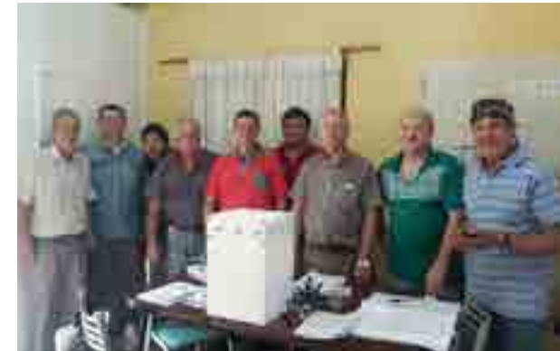
La mesa electoral en la Delegación Colón.

años, y la que va a acompañarme en estos cuatro que siguen, también está consustanciada con estas ideas, y al mismo tiempo estamos transmitiéndole poco a poco a nuestra juventud la responsabilidad de hacerse cargo de la conducción política de este gremio”, sostuvo el Secretario General, quien agradeció también a los integrantes de las listas opositoras, afirmando que “el gremio debe seguir unido como un puño, porque acá no hay más ganadores ni perdedores, sino un gremio que tiene una conducción elegida democráticamente, y cuya responsabilidad es garantizar la unidad para lograr los grandes objetivos que nos proponemos”.