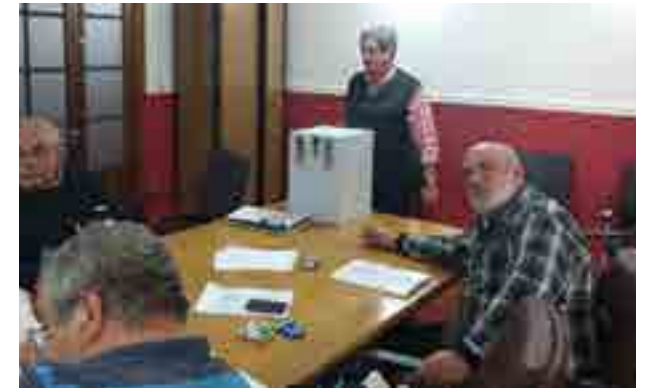
La mesa electoral en la sede de la Delegación Rosario.