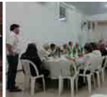
Colón celebró con una cena familiar en el Club Ñapinda.