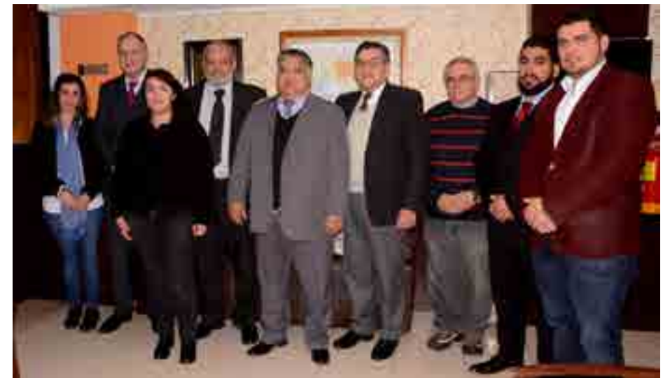
La nueva Comisión Directiva de la Obra Social en el acto de asunción en el Hotel Ribera Sur

REpetir: Comprobar que la persona sea capaz de repetir una serie de palabras o de frases.