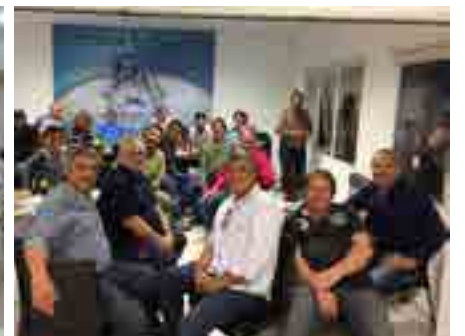
Un numeroso grupo de afiliados festejó en la sede gremial de San Nicolás.