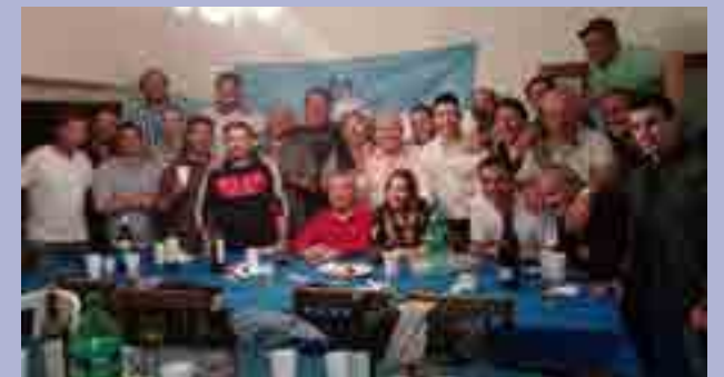
Ingeniero White festejó el Día del Marino con más de 40 afiliados en su sede.

Varias delegaciones del interior del país se sumaron a los festejos por el Día del Marino Mercante, con lo que la celebración tuvo carácter federal. Además de la multitudinaria reunión en el centro recreativo de La Reja (foto izquierda), otras sedes compartieron con su gente esta significativa fecha. La Delegación Bahía Blanca (foto derecha) reunió en su sede de Ingeniero White a más de 40 afiliados con sus familias.