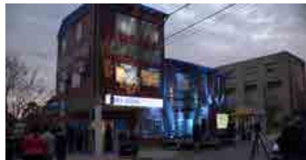
La nueva sede en Puerto San Martín